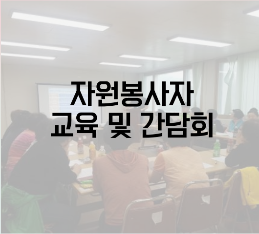
자원봉사자 교육 및 간담회